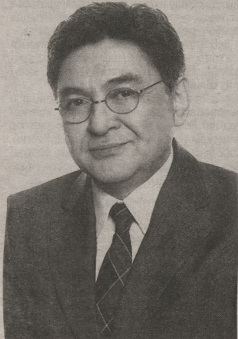
С благословения Олжаса Сулейменова